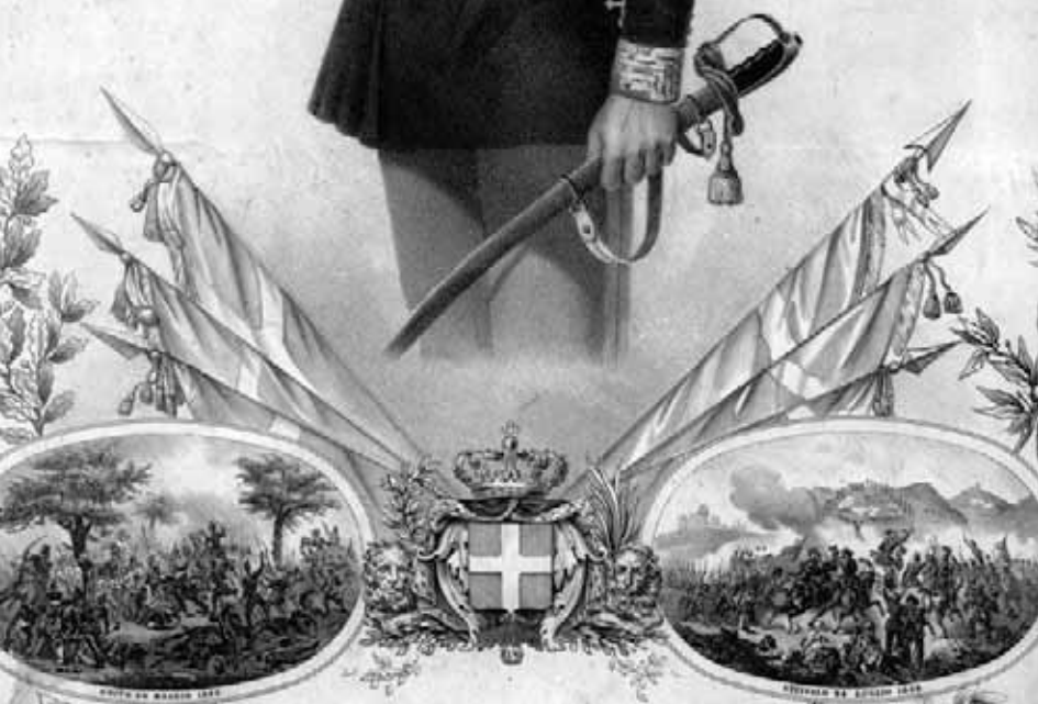
VITTORIO EMANUELE III. RE DI SARDEGNA