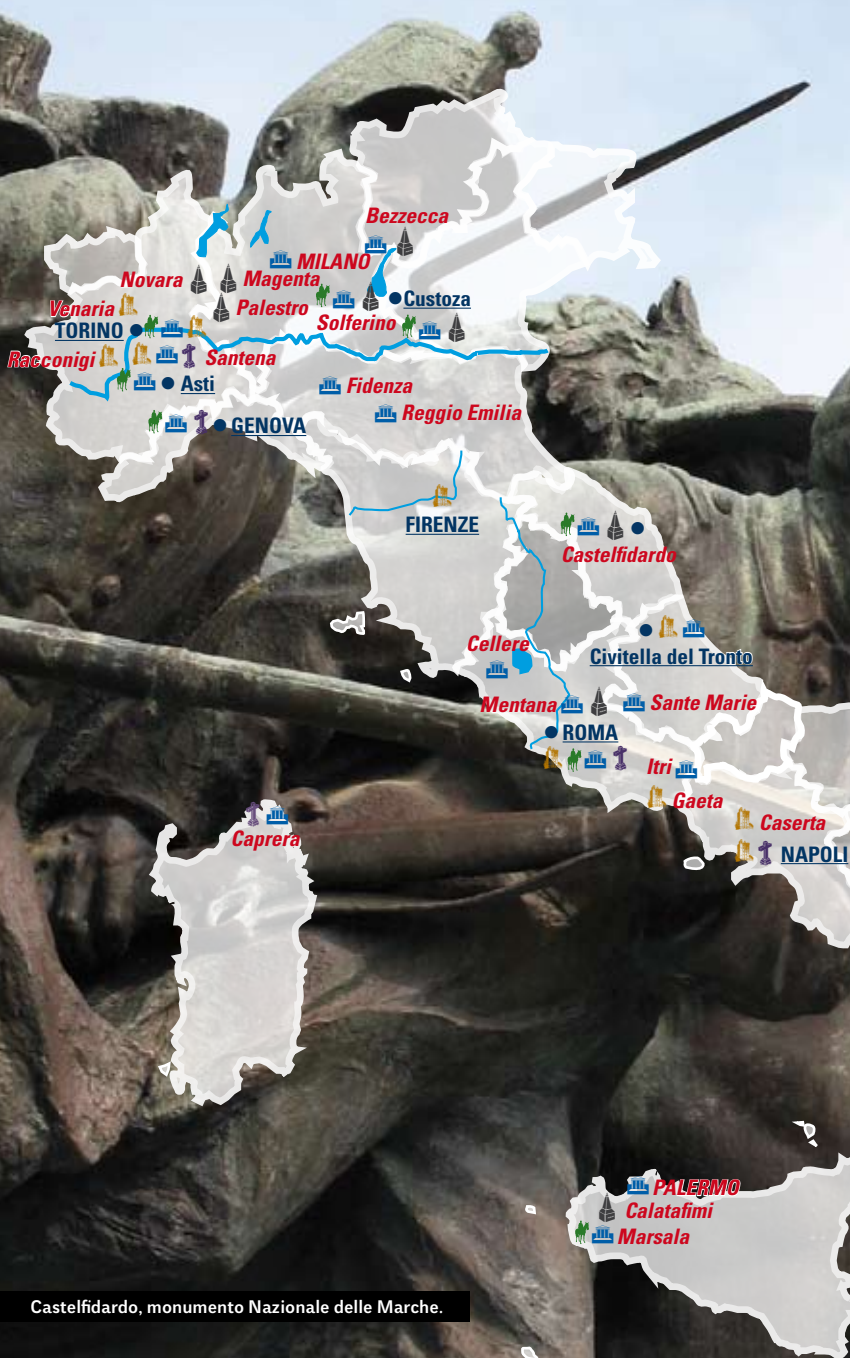
Castelfidardo, monumento Nazionale delle Marche.