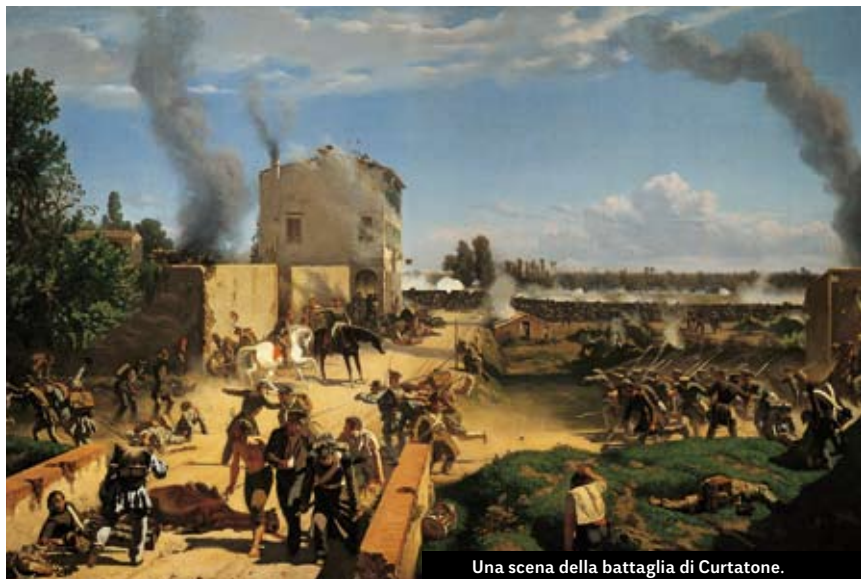
Una scena della battaglia di Curtatone.

Per il Regno di Sardegna è però vitale il dimostrare che la guerra in corso non è animata da spirito di conquista, bensì di liberazione. E si teme che, nel capoluogo lombardo, possa affermarsi una tendenza repubblicana. Il 30 aprile, a Pastrengo (Verona), le truppe del sovrano (che finisce con coraggio, ma anche con una certa dose di incoscienza, per ritrovarsi nel bel mezzo della mischia) costringe gli austriaci alla ritirata. Ma poi ordina: “Pour aujourd'hui il y en a assez” (Per oggi basta). E non insiste oltre. Il 6 maggio, a Santa Lucia, in un campo trincerato alle porte di Verona, al termine di un sanguinoso scontro, egli ottiene un'altra parziale vittoria. Tuttavia, ancora una volta, desiste dal proseguire nell'azione.