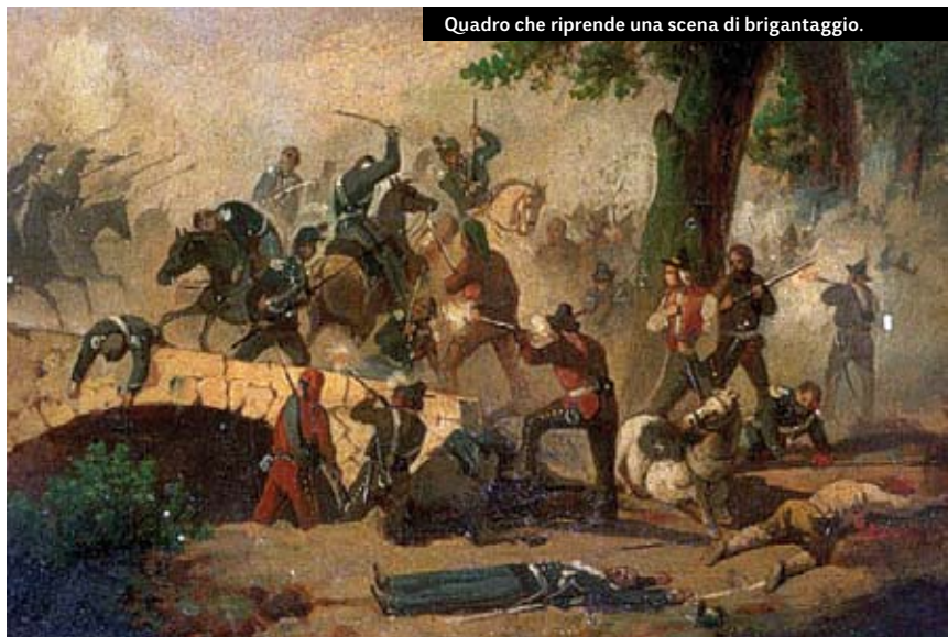
Quadro che riprende una scena di brigantaggio.

Sempre riguardo al Sud, alla luce dei fatti l’Unità d’Italia era stata un autentico shock sia per i sabaudi conquistatori, che credevano di trovare, grazie a idealizza-