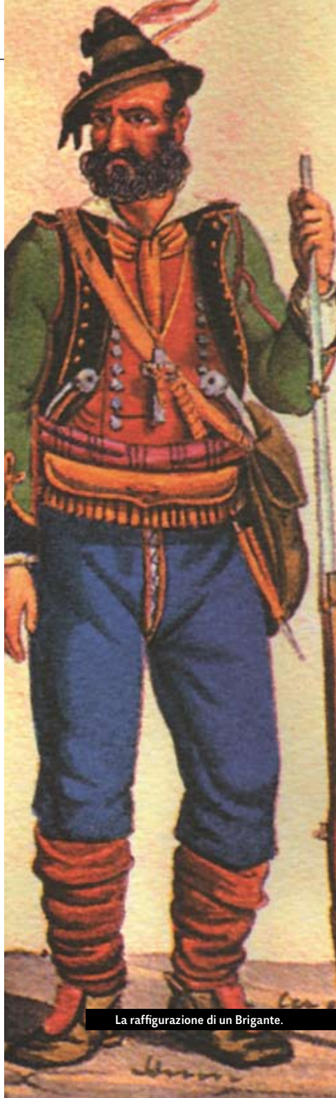
La raffigurazione di un Brigante.

Il 7 agosto 1861, in occasione della festa del patrono San Donato, una banda di briganti agli ordini di Co-