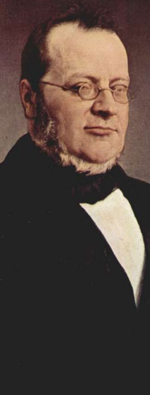
Camillo Benso, conte di Cavour.

non è nata da movimento di massa e meno che meno dall'espressione di una precisa volontà popolare.