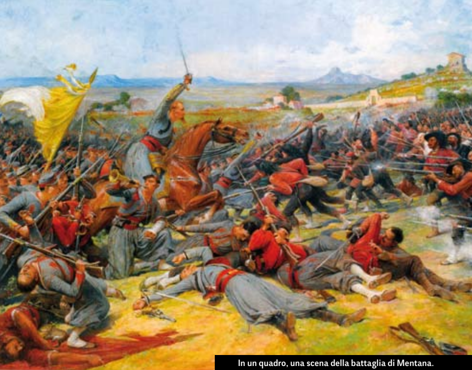
In un quadro, una scena della battaglia di Mentana.

lo sulle farine colpisce soprattutto le classi meno abbienti (si calcola l'equivalente di 10 giornate lavorative all'anno). Il generale Raffaele Cadorna è incaricato di reprimere gli inevitabili disordini sorti ovunque, nel corso dei quali le vittime supereranno il numero di 250.