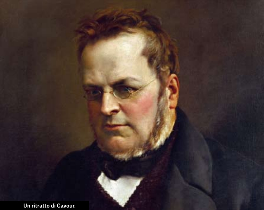
Un ritratto di Cavour.