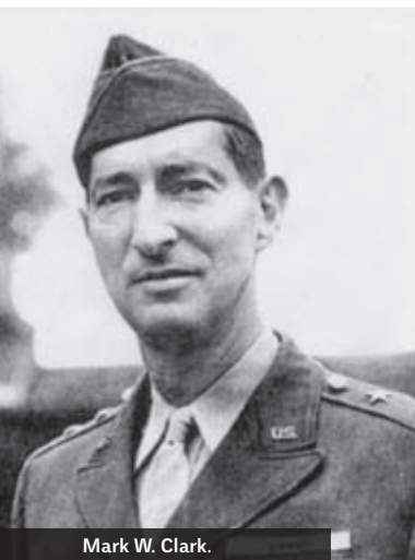
Mark W. Clark.

Nato a Madison Barracks, New York, il 1° maggio 1896, figlio di un colonnello dell'esercito americano, frequentò l'accademia di West Point dove si diplomò ufficiale nel 1917. Dal giugno 1918, col grado temporaneo di capitano nell'11° reggimento di fanteria, combatté nella Grande Guerra sul fronte occidentale in Francia. Dopo il conflitto, ricevette nel 1935 la nomina di comandante dei Centri di addestramento dell'esercito americano e, nel 1941, fu promosso Assistente capo del Quartier generale. Un anno dopo arrivò la nomina a comandante delle forze Alleate impegnate nel nuovo teatro di guerra nord-africano e, nel 1943, quella di comandante della Quinta Armata che di lì a poco avrebbe iniziato la Campagna d'Italia sbarcando in Sicilia e arrivando fin sulla Linea Gotica.