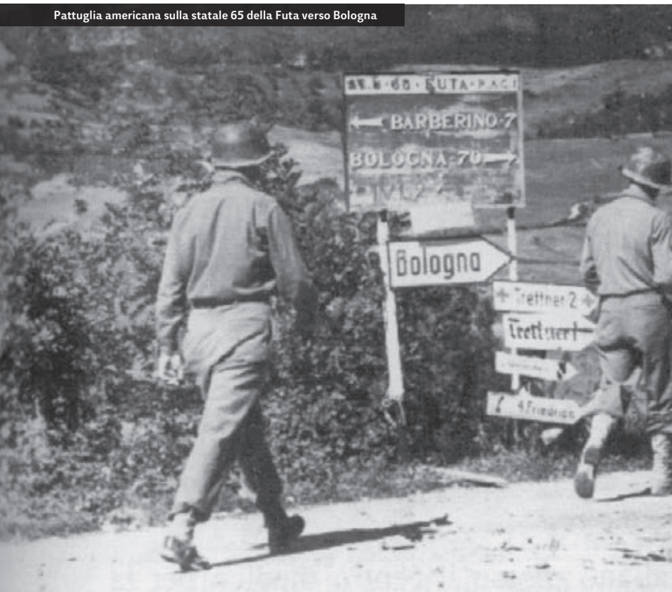
Pattuglia americana sulla statale 65 della Futa verso Bologna

A questo punto Clark decide di spostare la direttrice d'attacco lungo la statale della Futa e puntare direttamente su Bologna. Arriva a dare man forte anche la 78 a divisione britannica proveniente dall'Egitto. Fra il 3 e il 5 ottobre, sull'Appennino bolognese sono liberate Castel di Casio, San Benedetto Val di Sambro, Loiano, Monzuno e Porretta Terme. Il 6 ottobre i sudafricani sono sul monte Vigese e pochi giorni dopo gli