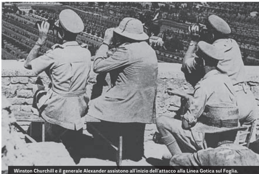
Winston Churchill e il generale Alexander assistono all'inizio dell'attacco alla Linea Gotica sul Foglia.

meridionale. Il piano di Alexander ha però trovato una pessima accoglienza fra i vertici americani, intenzionati ad aprire il secondo fronte francese dopo lo sbarco in Normandia avvenuto il 6 giugno. Sono così riaffiorati i mai sopiti contrasti tra Churchill e il presidente americano Roosevelt a proposito delle strategie da adottare sul fronte italiano che, ancora una volta, vede tramontare la possibilità di essere chiuso rapidamente e che, anzi, gli americani stanno pensando di abbandonare. “Abbiamo perso la possibilità di vibrare ai tedeschi il colpo più formidabile e, molto verosimilmente, di raggiungere Vienna prima dei russi, con tutto quello