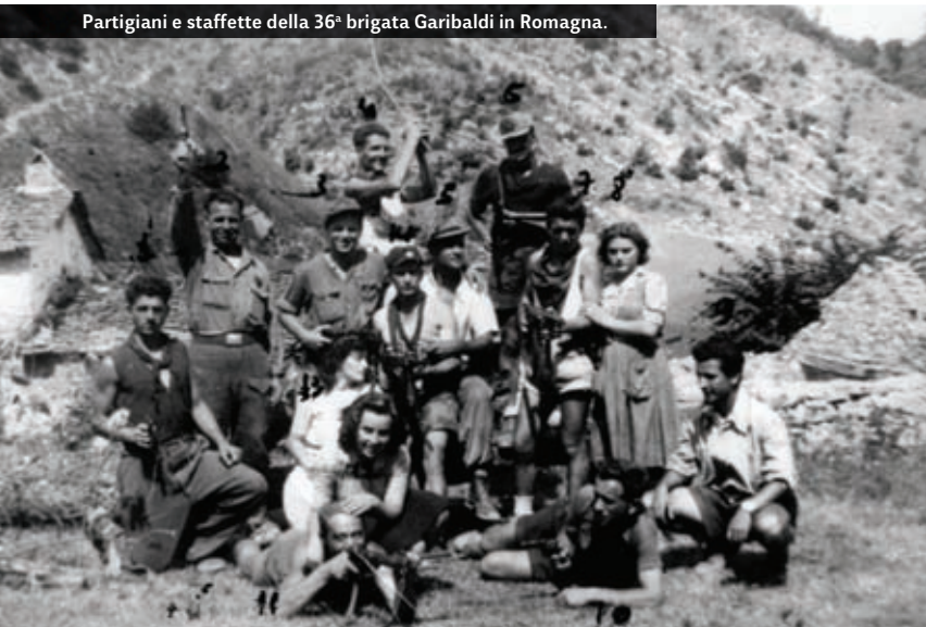
Partigiani e staffette della 36 a brigata Garibaldi in Romagna.

divisione corazzata, la 65 a fanteria e la 16 a SS Panzergrenadier. In riserva, la 29 a divisione Panzergrenadier, posizionata a nord di Firenze, e la 20 a divisione da campo Luftwaffe, vicino Viareggio. In più, nelle immediate retrovie tirreniche, è schierata l'Armata Liguria del maresciallo Rodolfo Graziani, di composizione mista italo-tedesca, che da parte germanica vede schierate nell'orbita del fronte della Gotica, la 34 a divisione fanteria e la 42 a Jaeger, oltre a due divisioni fasciste italiane.