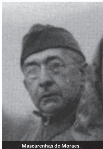
Mascarenhas de Moraes.

Nato a São Gabriel, nello stato brasiliano del Rio Grande do Sul il 13 novembre 1883, frequentò la Scuola militare Praia Vermelha a Rio de Janeiro. Di posizioni lealiste verso il precedente governo, con l'avvento al potere di Getúlio Vargas (1930) fu arrestato per due volte finché, nel 1935, mentre era in servizio alla Scuola militare Realengo, prese parte alla repressione del sollevamento militare dell'“Intentona Comunista”. La sua fedeltà fu ripagata e, nel 1937, divenne generale e assunse il comando delle regioni militari di Recife e São Paulo. Nel 1943 fu nominato comandante della divisione che costituì la Força Expedicionária Brasileira (FEB), il contingente brasiliano che partecipò alla Seconda guerra mondiale in appoggio alla Quinta Armata americana. Giunto in Italia con il primo scaglione di truppe nel giugno 1944, vi rimase fino al maggio 1945, dopo aver comandato la FEB sul fronte della Linea Gotica. Nel dopoguerra fu comandante della regione militare di Rio de Janeiro e poi, nel 1951, divenne Capo di Stato Maggiore dell'esercito brasiliano. Nominato maresciallo, morì a Rio de Janeiro il 17 settembre 1968.