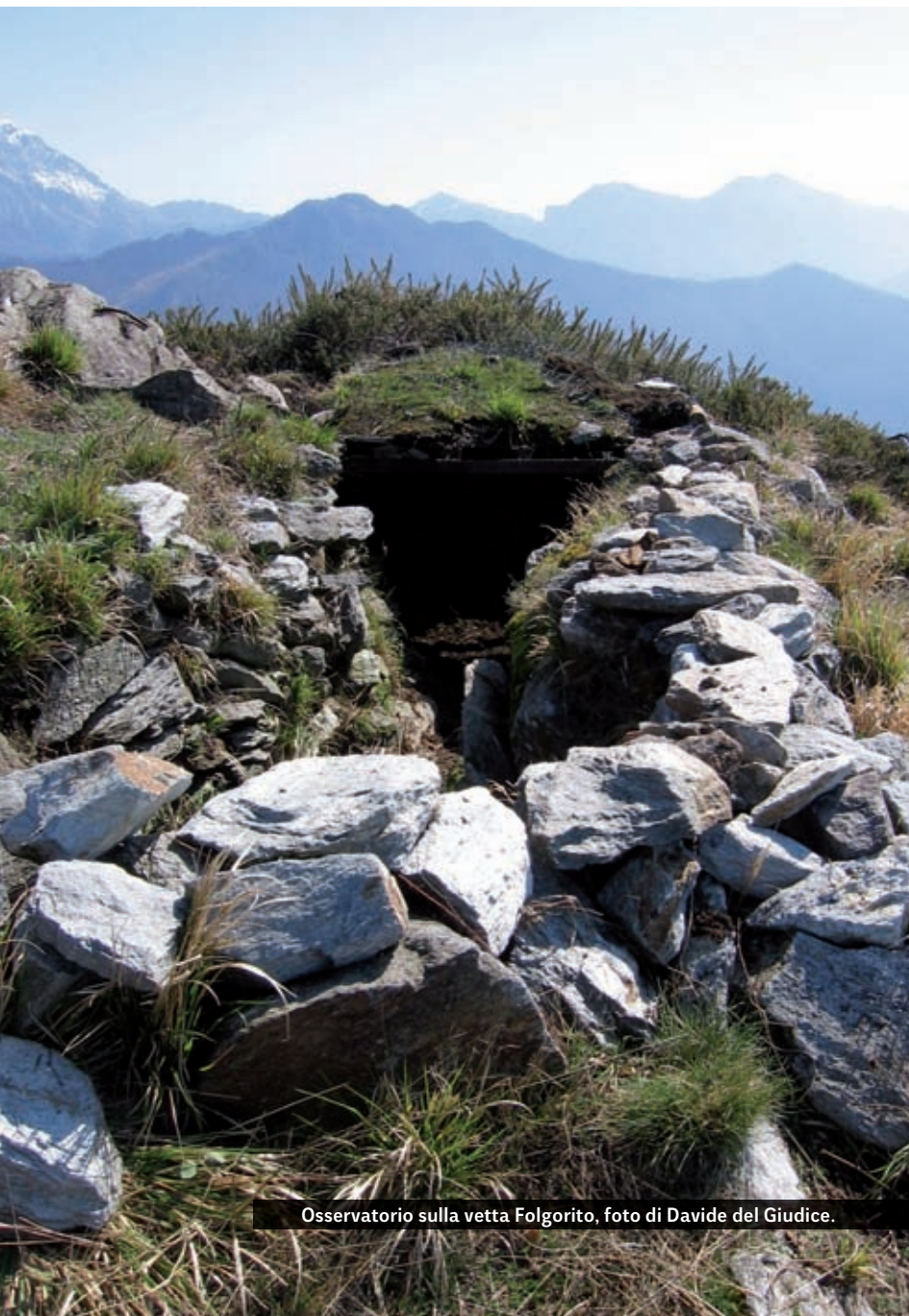
Osservatorio sulla vetta Folgorito.