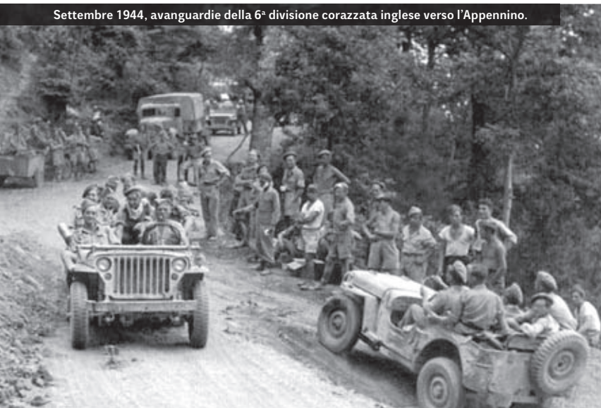
Settembre 1944, avanguardie della 6ª divisione corazzata inglese verso l'Appennino.

sono costretti ad arretrare sulla seconda linea difensiva a nord del fiume Conca. Soltanto la 4ª divisione indiana, dopo aver conquistato il baluardo di Montecalvo, rimane indietro e combatte a Tavoleto ed Auditore, dove i tedeschi saranno snidati dai gurkha che attaccheranno i due capisaldi all'arma bianca.