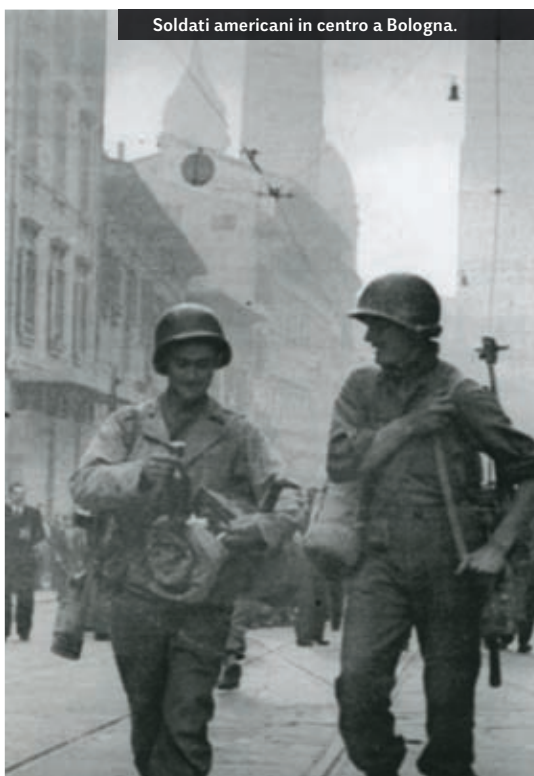
Soldati americani in centro a Bologna.

6 Novembre Nel settore del XIII Corpo, gli indiani e i gurkha catturano