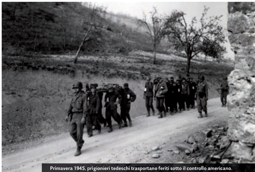
Primavera 1945, prigionieri tedeschi trasportano feriti sotto il controllo americano.

italiano del 2 maggio. Sono passati otto mesi da quando, nella tarda estate del 1944, l'offensiva muoveva sulle rive del Metauro sospinta da vane speranze e calcoli di una rapida conclusione. Sono seguiti duecento giorni di combattimenti e immani distruzioni, di tattiche fallaci e di stragi di civili inermi. La Linea Gotica non è stata soltanto un fronte difensivo, ma un solco profondo che ha segnato le terre e le genti del Montefeltro, della Romagna, dell'Emilia e della Toscana, i cui segni sono rimasti fino ai giorni nostri.