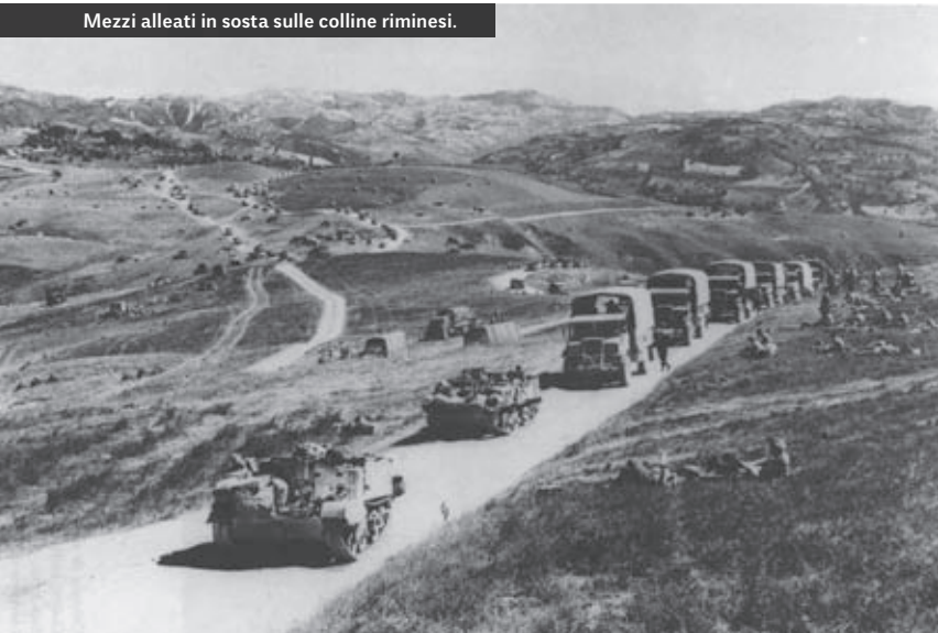
Mezzi alleati in sosta sulle colline riminesi.

sicura e violenta reazione tedesca. Invece, l'8 settembre, poche ore prima dello sbarco alleato a Salerno, Radio Algeri trasmette il comunicato con cui il generale Eisenhower annuncia l'uscita dell'Italia dal conflitto. Badoglio non può far altro che adeguarsi e annuncia al paese l'armistizio, gettando le truppe italiane dislocate in Italia, in Francia, nei Balcani e in Grecia nel caos più totale. I tedeschi, intanto, non perdono tempo e danno subito il via all'occupazione della penisola, disarmando e catturando i soldati dell'esercito italiano, rimasti senza alcuna guida, dopo la precipitosa fuga dei sovrani, del governo e dei vertici militari a Brindisi.