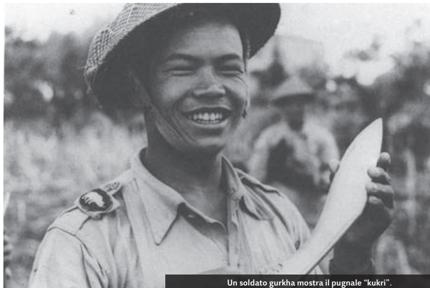
Un soldato gurkha mostra il pugnale “kukri”.

La Linea Gotica, come la stessa Campagna d'Italia, costituì un luogo di scontro militare, ma anche d'incontro fra culture diverse. Su questo fronte, infatti, inquadrati nelle due armate alleate e nelle due tedesche, combatterono soldati di oltre quaranta paesi diversi, che nei lunghi mesi dello stallo del fronte, entrarono a loro volta in contatto con le