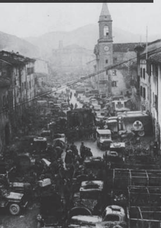
Assembramento di mezzi alleati a Castel del Rio.

gono per primi Castiglione dei Pepoli. I greci entrano a Bellaria.