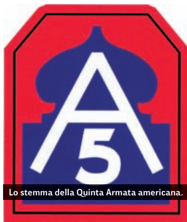
Lo stemma della Quinta Armata americana.

Gli alleati sono così costretti a studiare un piano di aggiramento delle difese tedesche mediante uno sbarco a nord della Linea Gustav, che avviene il 22 gennaio 1944 ad Anzio, ad opera del contingente anglo-americano al comando del generale John Lucas, il quale però, anziché puntare subito su Roma, si trincerò, dando modo a Kesselring di organizzarsi e contrattaccare con la neonata Quattordicesima Armata tedesca. Gli americani sono obbligati a rimanere sulla difensiva per i