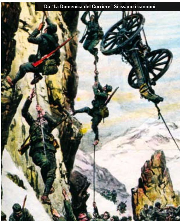
Si issano i cannoni.

Ancora più indietro, ma non oltre 60 chilometri dal Fronte, sorgono infine i Comandi delle Grandi unità; le strutture burocratiche del Regio Esercito; gli uffici; i magazzini e i depositi omnicomprensivi; gli ospedali divisionali e d'Armata; i convalescenziari; gli aeroporti; i forni e le cucine da campo; i luoghi di raccolta per i quadrupedi da trasporto e da macello; i campi di internamento per prigionieri di guerra nemici etc..