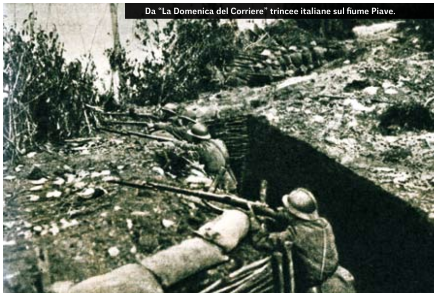
trincee italiane sul fiume Piave.

Il 29 ottobre ecco raggiungere Treviso, per rendersi conto della situazione creatasi sul Fronte italiano, il Capo di stato Maggiore generale e comandante in capo delle Forze dell'Intesa, maresciallo Ferdinand Foch. Il francese ascolta con pazienza, ma anche con crescente irritazione, gli