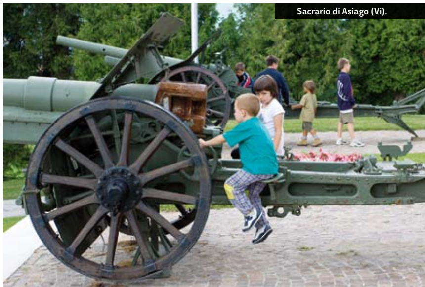
Sacrario di Asiago (Vi).

alcuno a Trieste. E ribadisce tale offerta all'Italia il 16 aprile, pur rimandando il tutto a guerra ultimata. Ma, a questo punto è troppo tardi. Anzi, "toujours trop tard" (sempre troppo tardi), come amava ripetere l'imperatore dei francesi Napoleone Bonaparte I, riferendosi alle numerose prese di posizione adottate, a suo tempo, da Vienna, immancabilmente fuori tempo massimo.