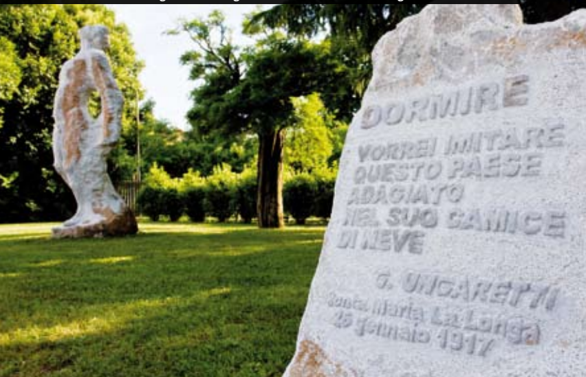
Santa Maria La Longa (Ud), il luogo della decimazione della brigata Catanzaro.

mila prigionieri, 100 mila dei quali non faranno ritorno a casa. Inoltre, 500 mila malati di tifo (solo 100 mila le guarigioni); quasi 500 mila colpiti da dissenteria cronica; 433.517 casi di tubercolosi; 1.276 casi di malattie veneree; oltre 30 mila colpiti da colera (5 mila morti, un numero incalcolabile di infetti, civili compresi); decine e decine di migliaia di colpiti da tifo petecchiale e addominale, tracoma, morbillo, difterite, scabbia, tigna, meningite cerebro-spinale, malaria e vaiolo. Mentre, poco più tardi, la terribile spagnola sarà destinata a mietere, solamente in Italia, oltre 500 mila vittime. Del conflitto patiscono ovviamente più di altri le popolazioni civili del nord-est dell'Italia. Per i bombardamenti (come quello di Gorizia), lo spostarsi del Fronte, i continui cannoneggiamenti, le requisizioni, i saccheggi, gli stupri, le devastazioni e l'alternarsi degli stati di occupazione italiana (numerose saranno i civili fucilati come spie) e, dopo la rotta di Caporetto, austro-ungarica.