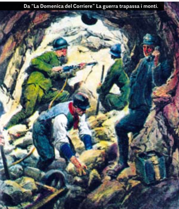
Da "La Domenica del Corriere" La guerra trapassa i monti.

15 giugno: gli austro-ungarici muovono una grande offensiva su tutto