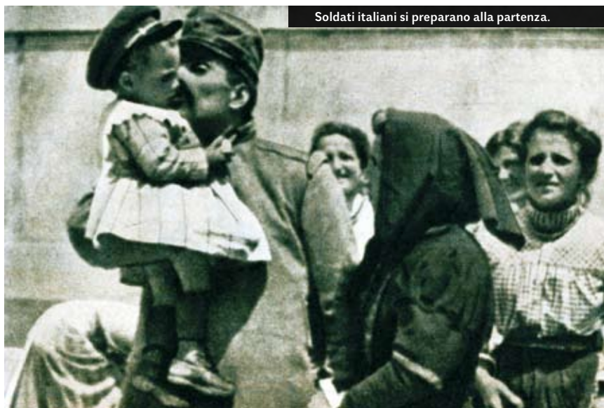
Soldati italiani si preparano alla partenza.

16 giugno: truppe del Regio Esercito danno inizio all'offensiva sugli altopiani.