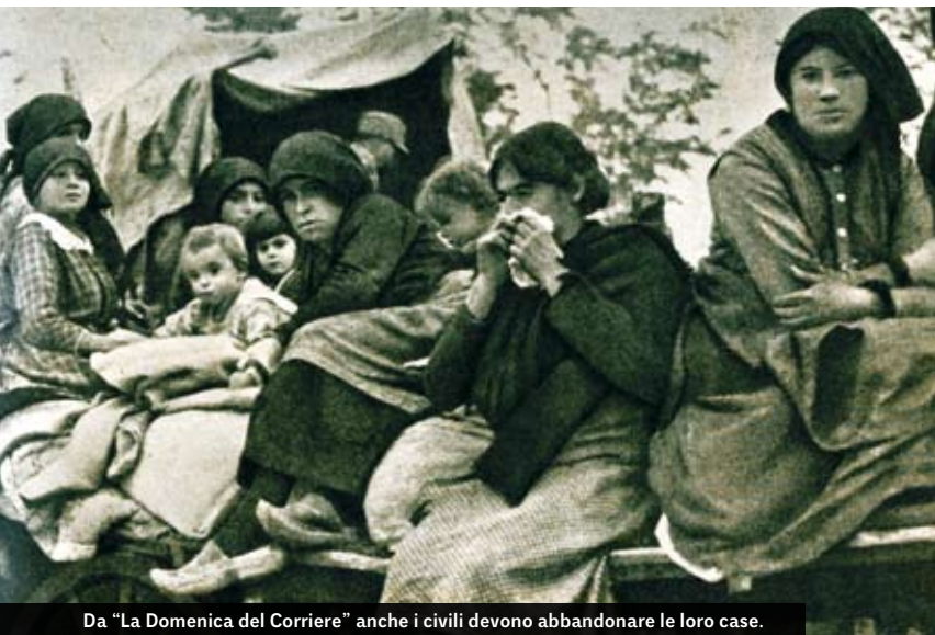
Da “La Domenica del Corriere” anche i civili devono abbandonare le loro case.

Il primo ministro Vittorio Emanuele Orlando ordina tuttavia il seque-