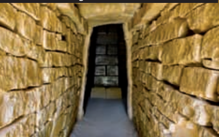
Dromos, ingresso ad una tomba di Vetulonia.