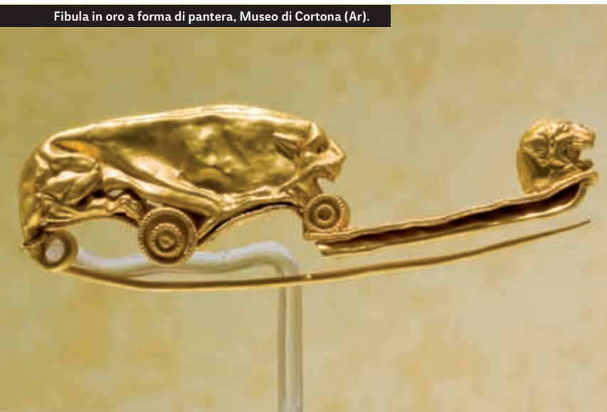
Fibula in oro a forma di pantera, Museo di Cortona (Ar).

fogge: a punta, conici, a cappuccio, a falde larghe; spesso identificavano l'appartenenza di coloro che li portavano ad una precisa classe sociale. A partire dal V secolo a.C. prevale l'uso di andare a capo scoperto. Pure dal V secolo a.C. gli uomini, che precedentemente usavano portare la barba, incominciarono a radersi il volto e tenere i capelli corti. Le donne ricorrevano alle più svariate acconciature: lunghi, pioventi, a coda, annodati o intrecciati dietro le spalle, in seguito lasciati cadere a boccoli sulle spalle, infine annodati a corona sul capo o raccolti in reticelle o cuffie. L'abbigliamento era completato da gioielli di squisita fattura, orecchini, collane, bracciali, fibule, pettorali, nella cui produzione gli Etruschi erano maestri. Particolare risalto nella società etrusca, ha la figura della donna, che, a differenza della coeva civiltà greca, godeva di grandi libertà. Gli autori greci stigmatizzarono questo fatto propagando la maldicenza sui costumi morali delle donne etrusche. Infatti, mentre le donne greche vivevano sottomesse al marito e passavano la maggior parte della loro vita chiuse in casa, le donne etrusche avevano il diritto di partecipare a tutti gli eventi pubblici, ai banchetti sedevano assieme ai loro uomini sui letti