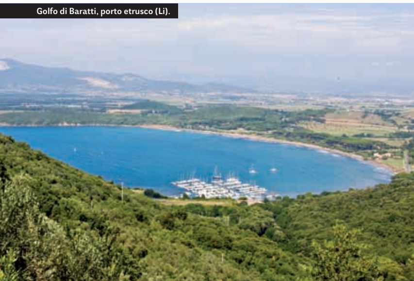
Golfo di Baratti, porto etrusco (Li).

questo periodo, infatti, che si comincia lo sfruttamento dei giacimenti metalliferi della costa tirrenica, ma si vengono a creare anche delle profonde trasformazioni sociali, dovute all'accrescimento di ricchezza di ristretti gruppi familiari, in grado di assumere il controllo e il possesso della terra. Si costruirà di fatto un struttura sociale, fatta di aristocrazia gentilizia, con schiavi e clienti, che sarà tipica del mondo etrusco fino al suo completo assorbimento nella società romana.