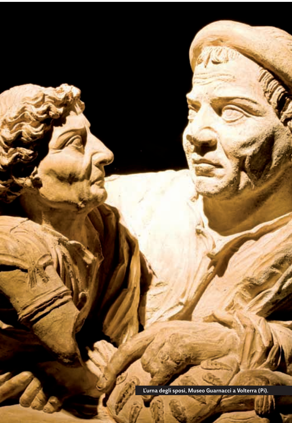
L'urna degli sposi, Museo Guarnacci a Volterra (Pi).