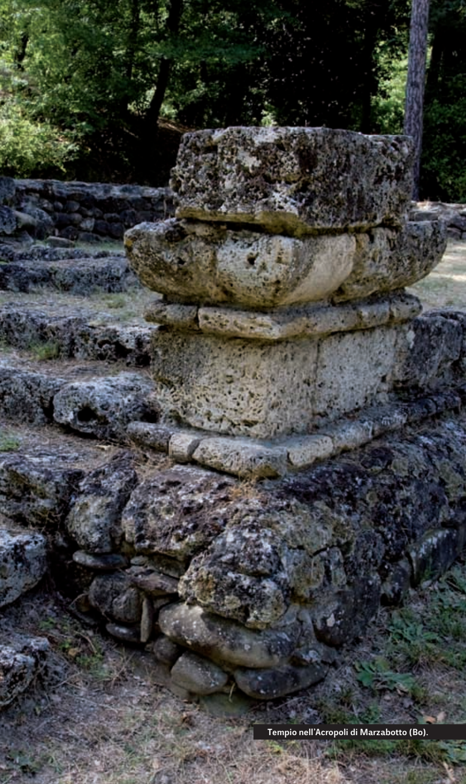
Tempio nell'Acropoli di Marzabotto (Bo).