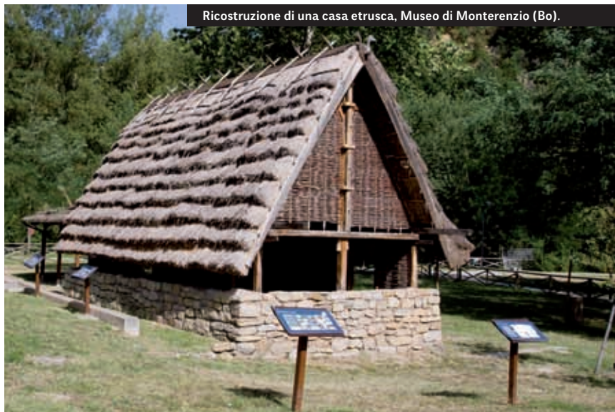
Ricostruzione di una casa etrusca, Museo di Monterenzio (Bo).

po in altezza. Secondo i precetti religiosi le strade dovevano incrociarsi ad angolo retto. Nella realtà, siccome spesso le città venivano edificate su alture, ciò era impossibile, e gli abitati si formavano adeguandosi alle caratteristiche del luogo, dando vita ad un tortuoso dipanarsi di stretti vicoli. I quartieri popolari erano abitati dalla classe dei servi: si trattava di uomini e donne liberi, che godevano dei diritti civili come la proprietà, ma che non avevano parte nella guida politica della città. Oggi possiamo distinguerli nelle iscrizioni funebri in quanto il loro nome non contiene l'indicazione della stirpe di appartenenza come per le classi gentilizie. I palazzi aristocratici invece erano decorati con splendide terrecotte architettoniche o lastre di rivestimento.