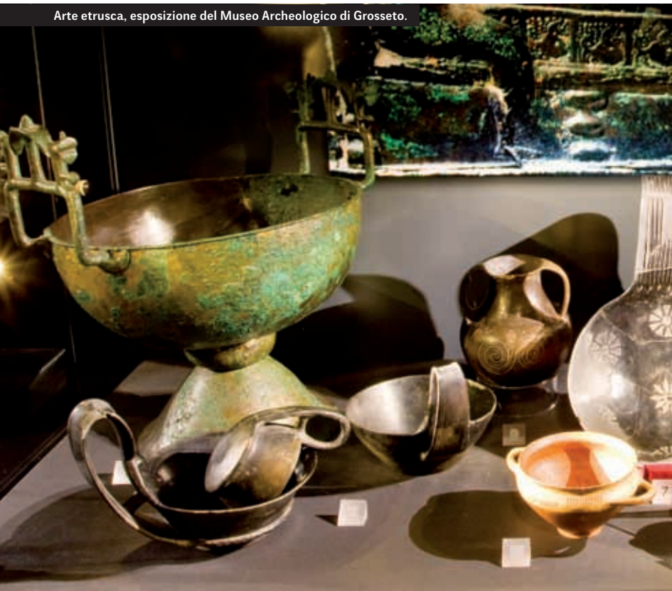
Arte etrusca, esposizione del Museo Archeologico di Grosseto.

Una frattura considerevole si ebbe agli inizi del III secolo a.C., quando Roma conquistò alcune delle città più attive dal punto di vista artistico. Nelle città più a settentrione, dove la conquista romana avvenne in modo meno traumatico, assunse importanza la produzione di urne cinerarie di Volterra, Chiusi e Perugia. Arte raffinata e diffusa in tutti i settori, fu la bronzistica, che dovevano realizzare con particolari processi di fusione.