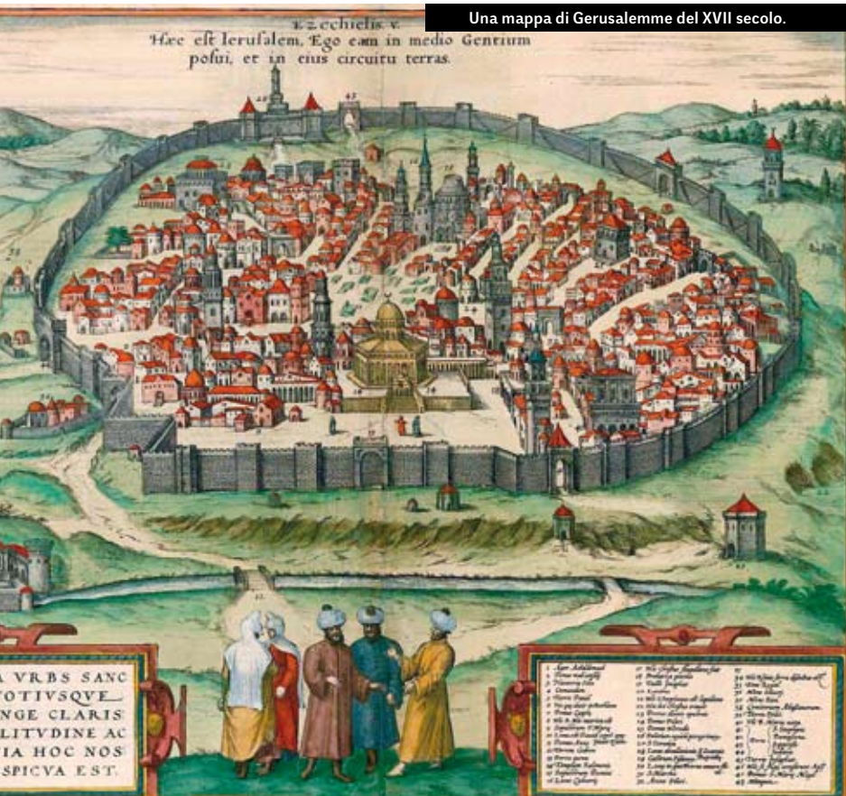
Una mappa di Gerusalemme del XVII secolo.

La Chiesa, sebbene in un primo momento non vedesse di buon occhio i pellegrinaggi poiché sfuggivano al controllo territoriale delle diocesi in quanto atti di pietà liberi e spontanei, quando divennero un fenomeno di massa, ne capì l'importanza facendosene protettrice e promotrice, premiandoli con la concessione di indulgenze spirituali e disciplinandoli tramite un apposito