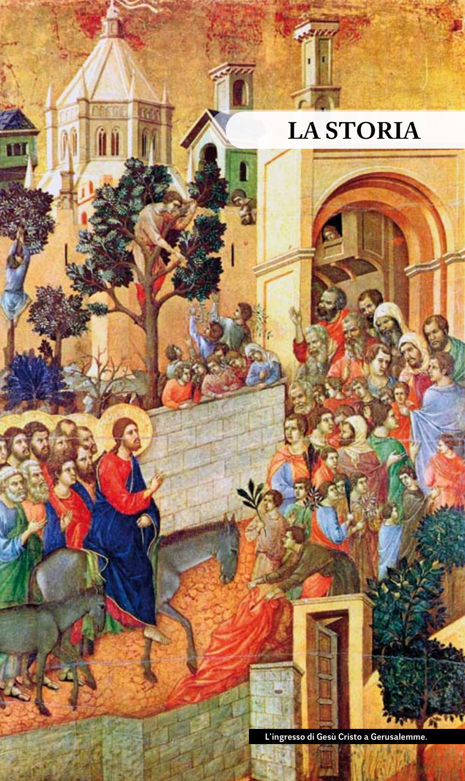
L'ingresso di Gesù Cristo a Gerusalemme.