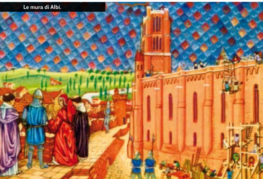
Le mura di Albi.

conosca (le altre sono, inizialmente, a Agen, Carcassonne e Tolosa). Per tale motivo, alla fine del XII secolo, quanti aderiscono alla religione che in essa si riconosce, i catari per l'appunto, vengono ribattezzati albigesi. Termine, quest'ultimo, in seguito abbandonato, ma poi riscoperto nel XIX secolo. Ma che, un tempo, probabilmente si riferiva soprattutto al fatto che il vescovo cataro di Albi, Cellerier Sicard, consacrato nel 1167 a Saint-Félix-Laugarais, era stato uno dei primi alti prelati a godere di buona fama. Oppure, al fatto che la Chiesa di Roma aveva tentato, qui, di spedire sul rogo alcuni eretici, ma la popolazione li aveva liberati con la forza. O ancora agli animati dibattiti teologici che, nel 1176, si erano svolti proprio in questo borgo tra predicatori cattolici e appartenenti alla nuova religione.