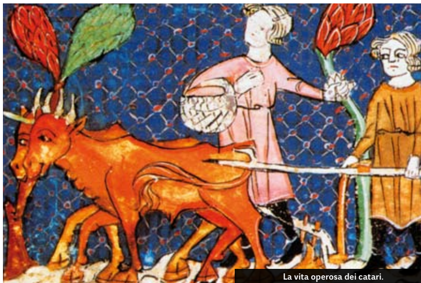
La vita operosa dei catari.

Conducono una vita comunitaria in piccole maisons (case); considerano il lavoro e la preghiera obbligatori; rifuggono la violenza e la menzogna; praticano l'austerità e la castità (quest'ultima il più delle volte in età avanzata, dopo avere praticato la vita di coppia, dato che il vero matrimonio è solo quello con Dio); e mantengono un'alimentazione vegetariana (con l'unica eccezione per il pesce).