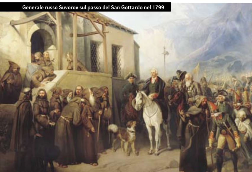
Generale russo Suvorov sul passo del San Gottardo nel 1799

scovo di Basilea e all'abate-principe di San Gallo. La Rivoluzione francese e le successive guerre napoleoniche cambiarono la faccia dell'Europa. L'invasione di Napoleone fu un momento decisivo nella storia della Svizzera. La Francia e la Confederazione Svizzera avevano coltivato rapporti molto stretti durante quasi tre secoli. Durante tale periodo i cantoni svizzeri fornivano mercenari per difendere la monarchia francese. Solo dal 1797 i cambiamenti in Francia ebbero delle notevoli ripercussioni sulla situazione svizzera. In quel periodo la Francia cercò di creare attorno a sé dei bastioni contro le monarchie europee che tentavano di restaurare il vecchio regime. La Svizzera, in quanto paese limitrofo, si vide coinvolta nei piani francesi.