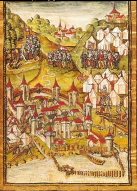
Le truppe borgognote di Carlo assediano Morat (1476)

ne presto il più richiesto, perché ritenuto più affidabile rispetto, per esempio, a quello tedesco dei lanzichenecchi. Da una consistenza valutata sulle 30.000 unità nei primi anni del Quattrocento si giungerà alle 150-200.000 del Cinquecento. Nella regione retica, nell'attuale territorio dei Grigioni, Coira, governata dalle corporazioni, aveva già manifestato nei primi anni della seconda metà del Trecento una sua vocazione federativa, quando con i comuni limitrofi e con l'Engadina aveva creato la federazione della Casa di Dio, "Lega Caddea" ( Gotteshausbund ), il 27 gennaio 1367: per un patto di reciproco soccorso oltre che per difendere – dallo stesso suo vescovo che