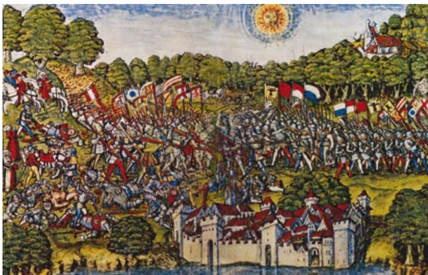
Rappresentazione della Battaglia di Sempach del 1386 in un acquerello anonimo del 1515