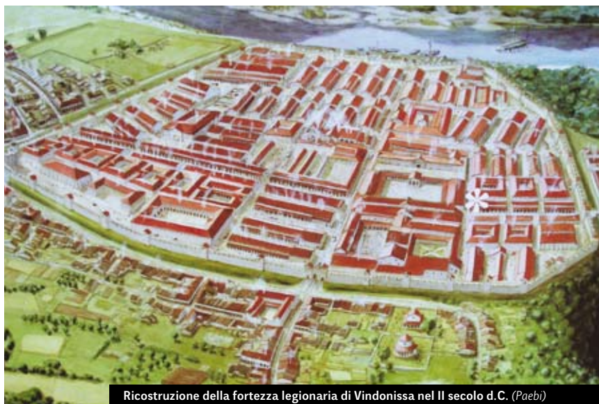
Ricostruzione della fortezza legionaria di Vindonissa nel II secolo d.C. (Paebi)

Vallensium e le concesse il diritto latino, che consentiva all'élite locale di accedere alla cittadinanza romana tramite l'esercizio di una magistratura. Il Vallese venne separato dalla grande provincia della Rezia e unito probabilmente alla Tarantasia per costituire la provincia delle Alpi Graie e Pennine.