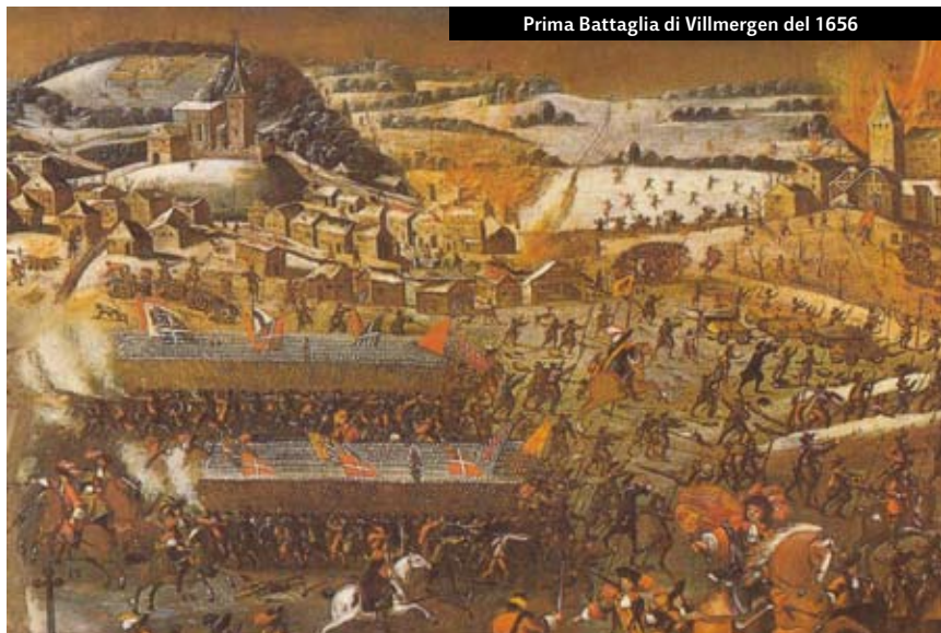
Prima Battaglia di Villmergen del 1656

La Svizzera fu la patria di due esponenti principali del movimento riformatore europeo (Ulrich Zwingli e Giovanni Calvino). Zwingli (1484-1531) nacque in una famiglia di contadini a Toggenburgo nella Svizzera