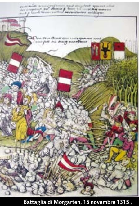
Battaglia di Morgarten, 15 novembre 1315 .

nipote Giovanni, il 1° maggio 1308. Il conte di Lussemburgo fu eletto suo successore dai principi elettori, nel novembre dello stesso anno, e divenne re Enrico VIII, il quale nel giugno del 1309 confermò ai tre Paesi forestali l'immediatezza imperiale - non riconosciuta dagli Asburgo-Austria - e li riunì in un baliaggio imperiale affidato al conte Werner von Homberg. Da allora i rapporti tra gli Asburgo e i Paesi forestali (in particolare Svitto) si deteriorarono. I duchi d'Austria cercarono di conservare la propria signoria territoriale su Svitto e Untervaldo. Anche la caccia agli assassini di Alberto I d'Austria (ucciso nel 1308 nei pressi di Königsfelden) nella Svizzera centrale fu all'origine di tensioni. Malgrado i numerosi tentativi di arbitrato, si acuirono