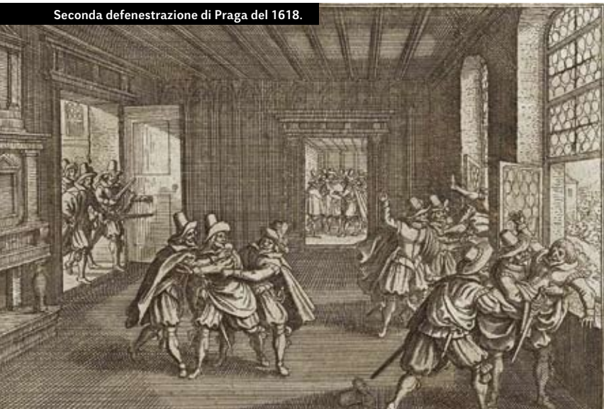
Seconda defenestrazione di Praga del 1618.

Il 1° gennaio 1515, il nuovo sovrano francese dichiarò guerra contro la Svizzera dopo aver allestito una notevole armata. Nel frattempo però la costellazione delle alleanze era mutata, sullo sfondo delle decise rivendicazioni spagnole su Milano, del riavvicinamento di Venezia alla Francia e dei meno determinati progetti egemonici di Leone X, successore di Giulio II. Si produsse di conseguenza un isolamento diplomatico dei Confederati, che nello scenario lombardo evidenziarono anche la loro incapacità di controllare in profondità, al di là di un'occupazione armata e dell'imposizione di tasse e tributi, le complesse strutture di uno Stato come quello milanese.