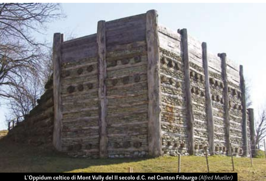
L'Oppidum celtico di Mont Vully del II secolo d.C. nel Canton Friburgo (Alfred Mueller)

di invasione. Si sperava che il ridotto sarebbe stato impenetrabile, anche nel caso in cui la maggior parte della Svizzera fosse caduta sotto l'occupazione nazista. La caduta della Francia in mano tedesca nel giugno 1940 aveva significato che, per la maggior parte della guerra, la Svizzera si trovasse circondata dai tedeschi e dai loro alleati.