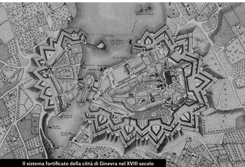
Il sistema fortificato della città di Ginevra nel XVIII secolo