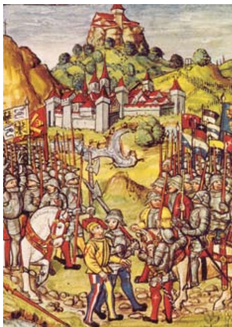
Scena della Battaglia di Novara del 1500