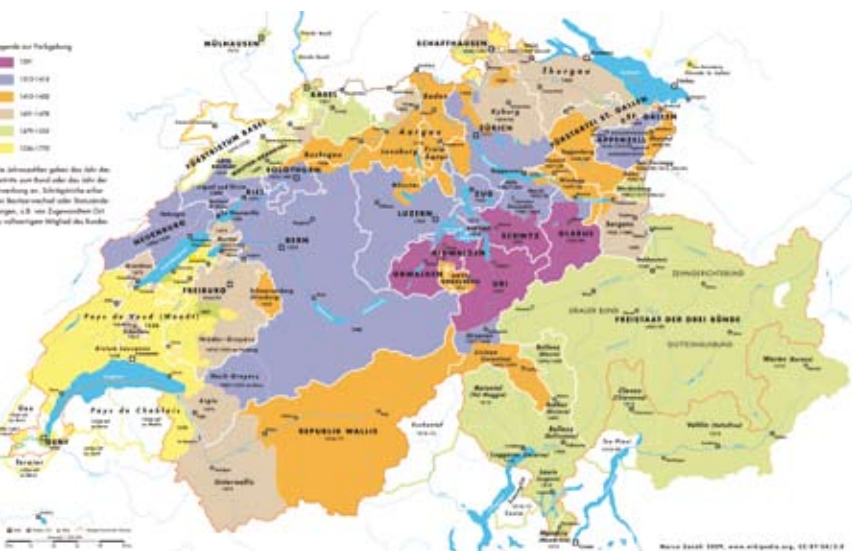
Carta dello sviluppo territoriale della Confederazione svizzera dal 1291 al 1798

nel regno franco la Rezia curiense . L'incoronazione imperiale a Roma (25.12.800) pose Carlomagno, in veste di imperatore dell'Occidente, sullo stesso piano dell'imperatore romano d'Oriente che risiedeva a Bisanzio. Furono testimonianze del suo accresciuto dominio la costruzione del palazzo di Aquisgrana, l'istituzione di un'amministrazione imperiale, la trasformazione della corte nel centro intellettuale dell'Impero (il cosiddetto rinascimento carolingio) e la riforma della Chiesa, che peraltro giunse al culmine solo con Ludovico il Pio (814-840), l'unico erede al trono di Carlomagno. Il progetto di spartizione dell'Impero (806), che garantiva un collegamento attraverso le Alpi a ciascuno dei tre figli di Carlomagno, ha probabilmente favorito l'introduzione del sistema comitale nella Rezia curiense. Il territorio elvetico, sotto l'egida della dinastia carolingia, con lo sviluppo del feudalesimo divenne un insieme di sovranità ecclesiastiche, laiche e cittadine.