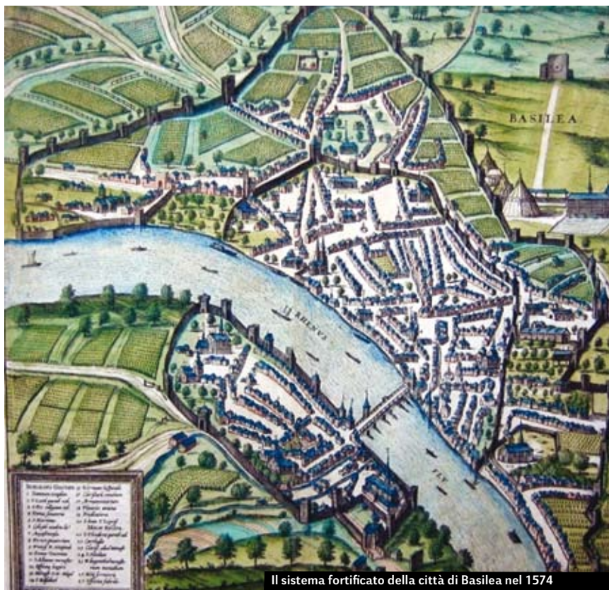
Il sistema fortificato della città di Basilea nel 1574

Nella Svizzera settentrionale comparvero verso il 200 a.C. insediamenti fortificati collinari dalle popolazioni celtiche (Basilea-Münsterhügel, Berna-Enge, Mont Vully, Yverdon), che i Latini chiamavano oppidum . La particolarità di questo tipo di fortificazione era il murus Gallicus , si tratta di un terrapieno con un'armatura di tronchi disposti longitudinalmente e trasversalmente, certe volte fissati con chiodi di ferro. Il lato frontale consisteva in un muro a secco di pietre rafforzato da pali che servivano da impalcatura per il parapetto. Ad assicurare le zone esposte provvedevano torri erette sopra il terrapieno. Vicino agli ingressi il murus Gallicus esisteva una rientranza, al suo interno si trovava la porta, la