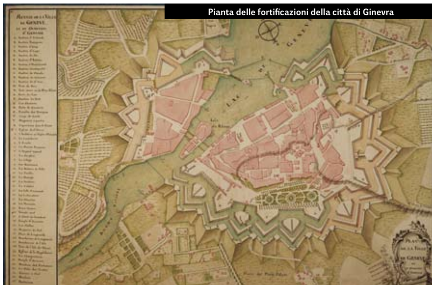
Pianta delle fortificazioni della città di Ginevra