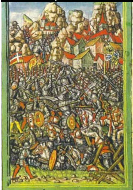
Scena della Battaglia di Giornico del 1478